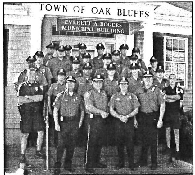
Oak Bluffs Police Department